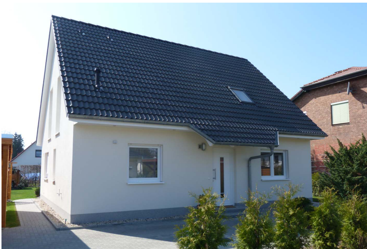
(Bauherrenvariante mit Extras)

Planung, Statik, Bauleitung Bauausführung mit eigenen Fachkräften