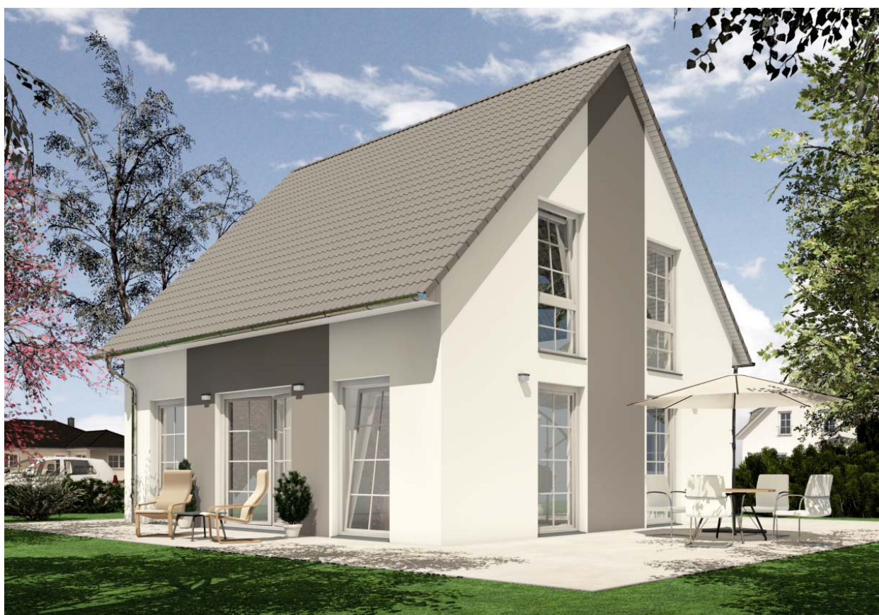
(Bauherrenvariante mit Extras)

Planung, Statik, Bauleitung Bauausführung mit eigenen Fachkräften